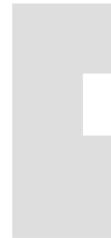
begane grond schaal 1 : 500