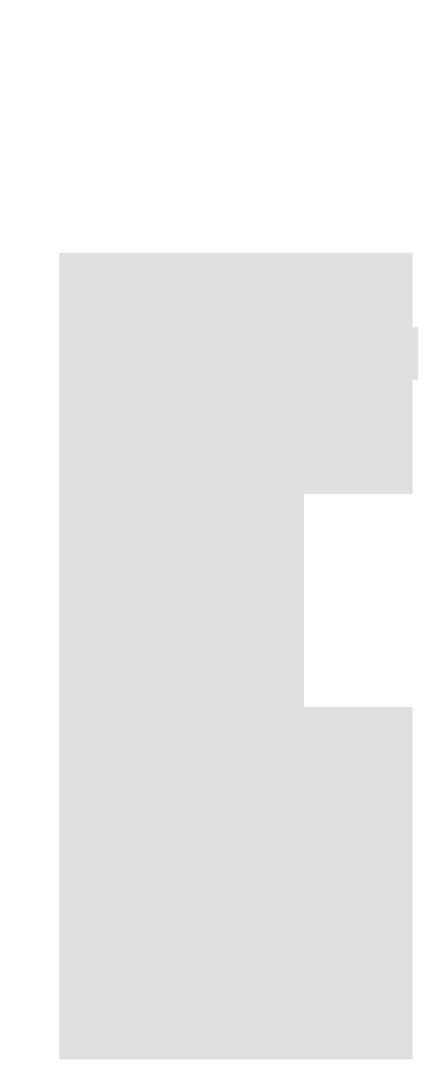
begane grond schaal 1 : 500