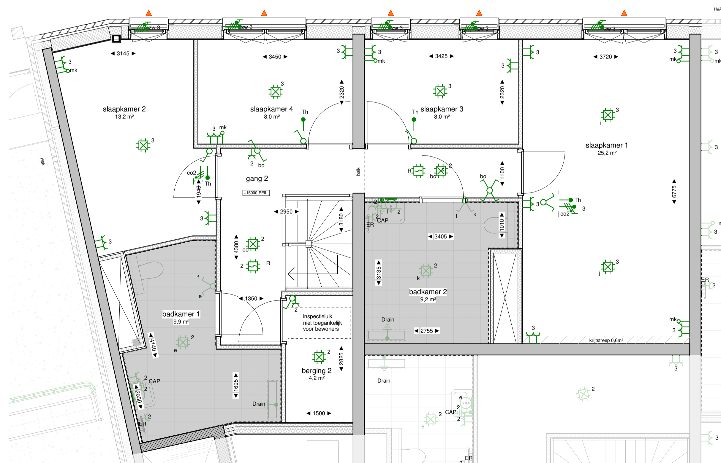
178-05 vijfde verdieping