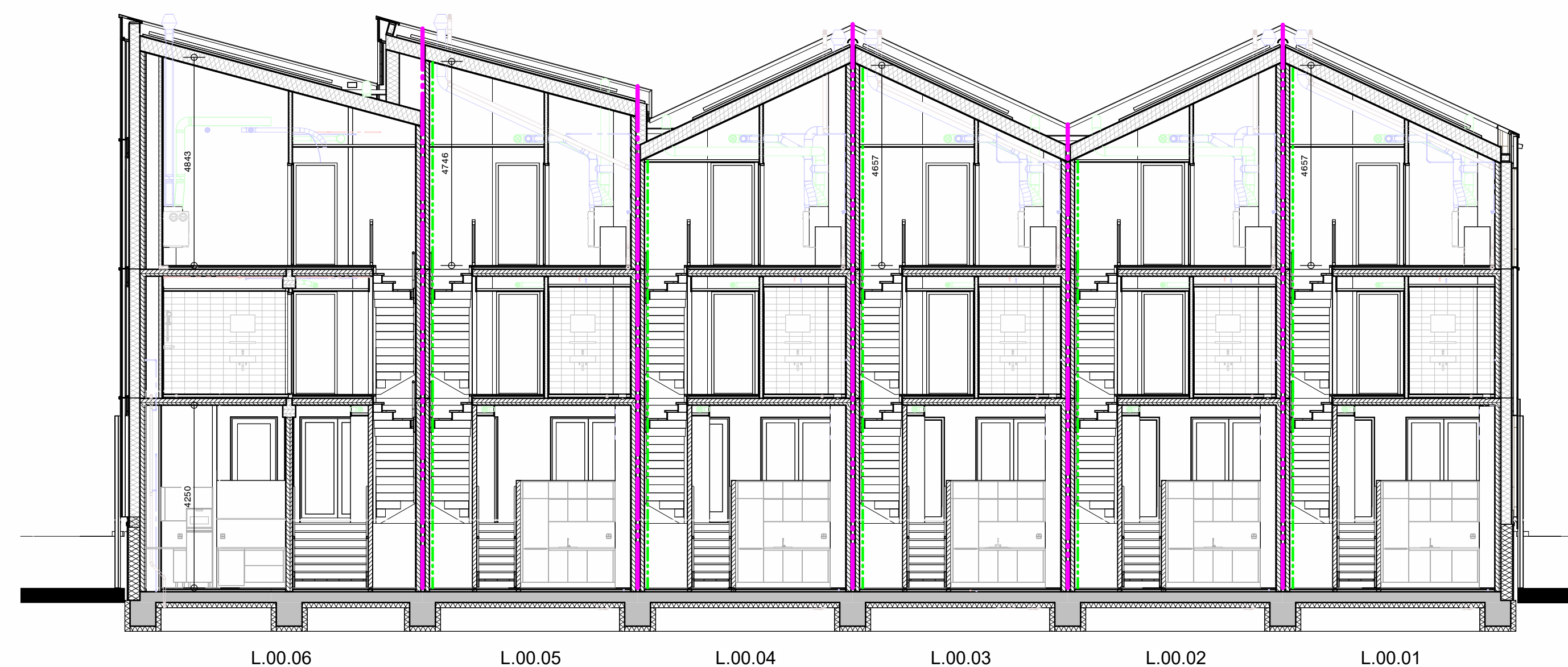
DOORSNEDE BLOK L1 & L2