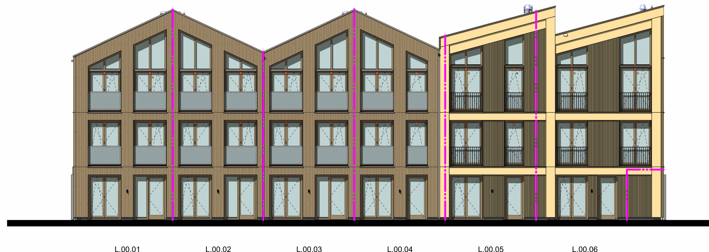
WESTGEVEL BLOK L1 & L2