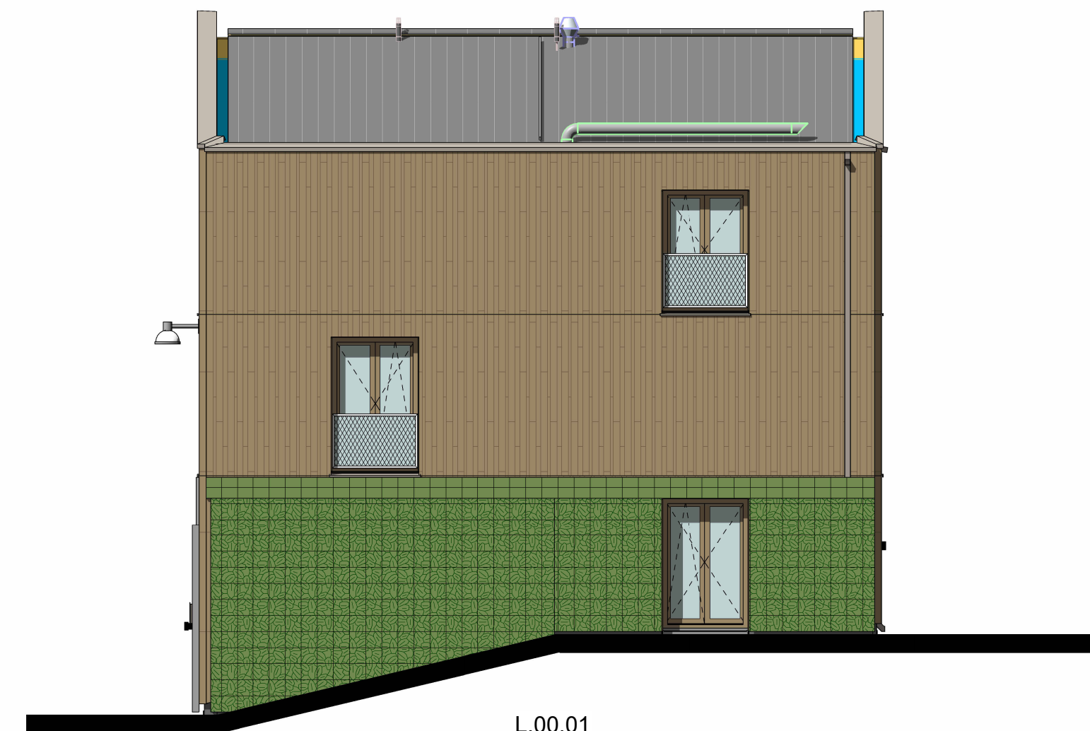
NOORDGEVEL BLOK L1