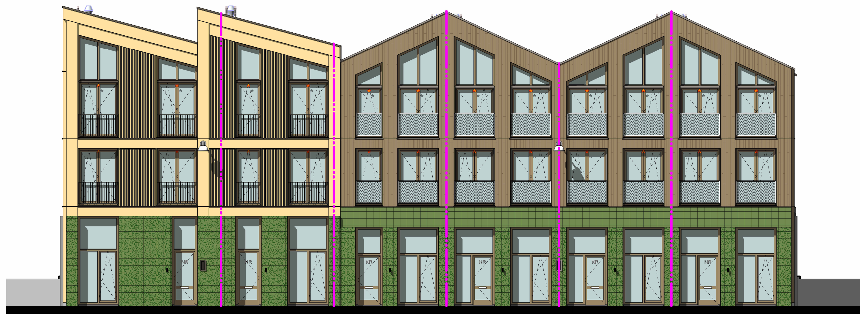
OOSTGEVEL BLOK L1 & L2